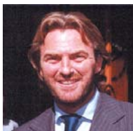
Bernabò Bocca Presidente

La Giunta Esecutiva dirige l'attività di Federalberghi. Presiede alla definizione degli obiettivi, all'assegnazione delle risorse ed al coordinamento delle attività.