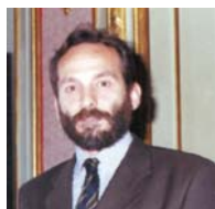
Paolo Giacalone Presidente Comitato Nazionale Piccole Imprese